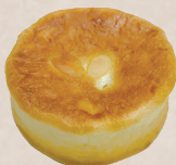
粒あんと豆乳クリーム 210円