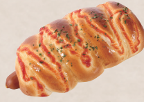
渦巻ソーセージ 260円