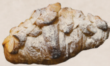
クロワッサンダマンド 260円