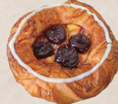
ダークチェリー デニッシュ 240円