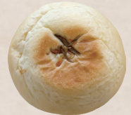
きんぴらおやき 220円