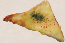
クロックムッシュ ハム&チーズ 250円