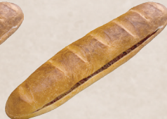
チョコレートフランス 240円