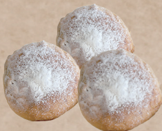
全粒粉くるみパン ロール 130円 / 3個入 390円