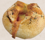
明太じゃがチーズ 340円