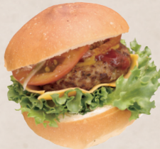
こだわり ハンバーグサンド 580円