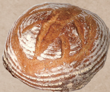
パン・ド・ロデブ [プレーン] 600円 / ハーフ 300円