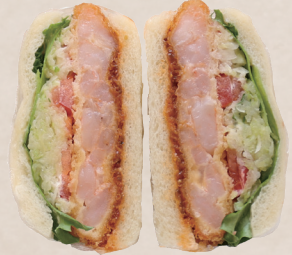
プリップリ エビカツサンド 580円