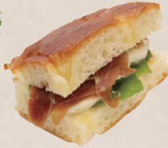
フォカッチャサンド 580円