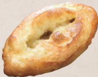
はちみつバター 230円