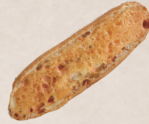
明太子フランス 240円