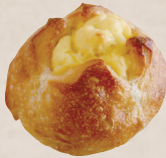
チーズフランス 280円