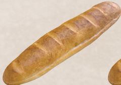
ミルクフランス 240円