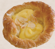
パティシエール 260円