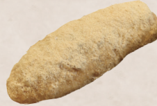
あげぱん きなこ 120円