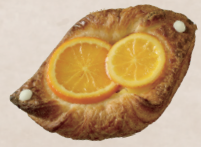
オレンジ デニッシュ 210円