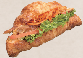
キャロットラペとマスタード チキンのクロワッサンサンド 450円