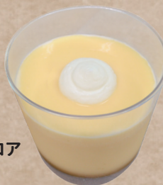
RINON プリン [カスタード・抹茶] バニラとフランボワーズのババロア 各 400円