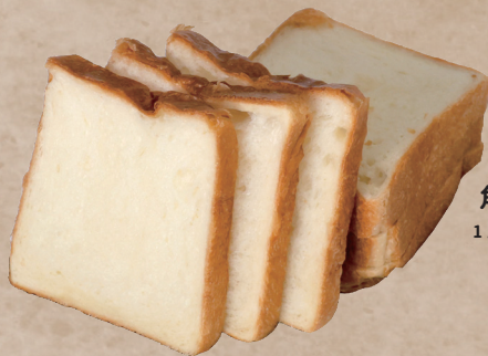
角食パン 1斤 340円