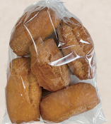
かりんとうドーナツ 150円