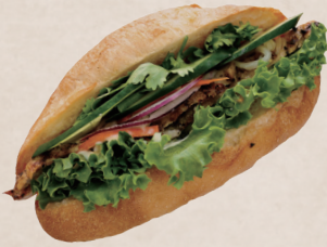
バインミー風 オリジナルサンド 580円