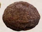
あげぱん ココア 120円