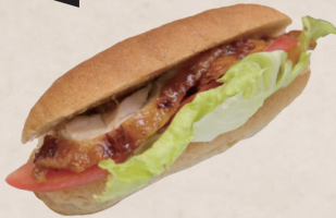
シャキシャキレタスの 照り焼きチキンサンド 450円