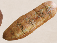
ガーリックフランス 220円