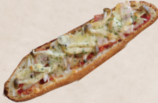
きのこベーコン タルティーヌ 320円