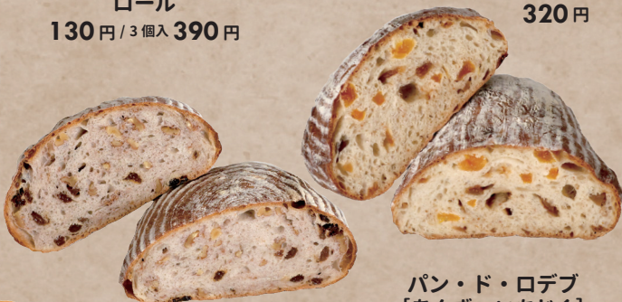
パン・ド・ロデブ [あんず・いちじく] 540円 / ハーフ 270円