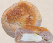
ペッパー W チーズくるみ 260円