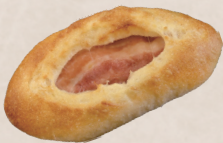
ベーコンエビミニ 200円