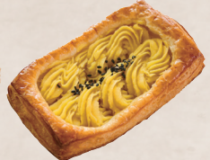
スイートポテト 280円