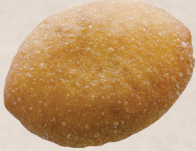
ワインビーフ カレーパン 300円