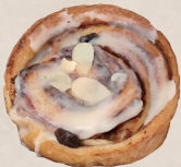
シナモンロール 350円